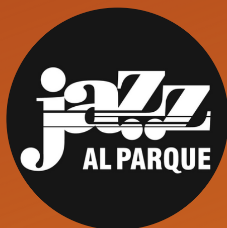
Jazz al Parque 2013, 2017 y 2020