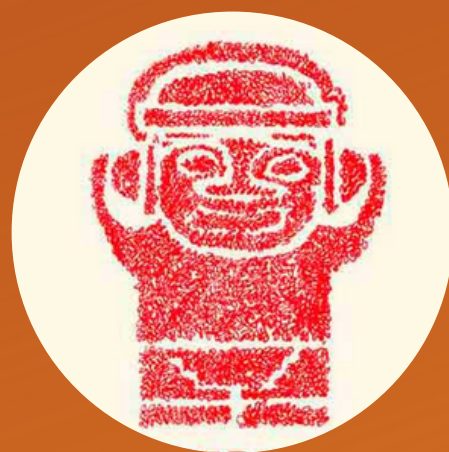
Festival Distritofónico 2014