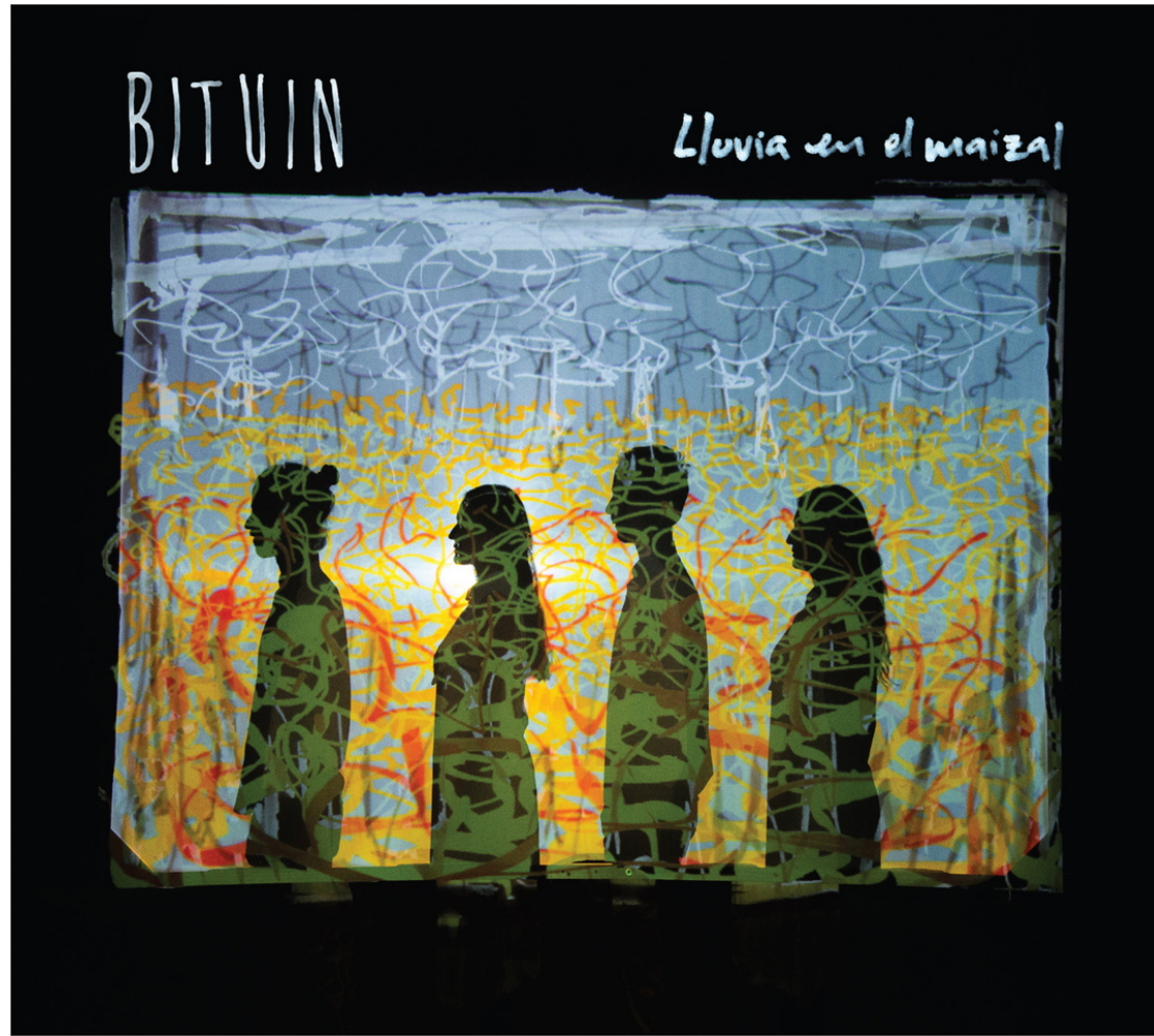
Lluvia en el Maizal (2018)