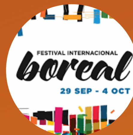
Festival Boreal 2020 (virtual) Tenerife