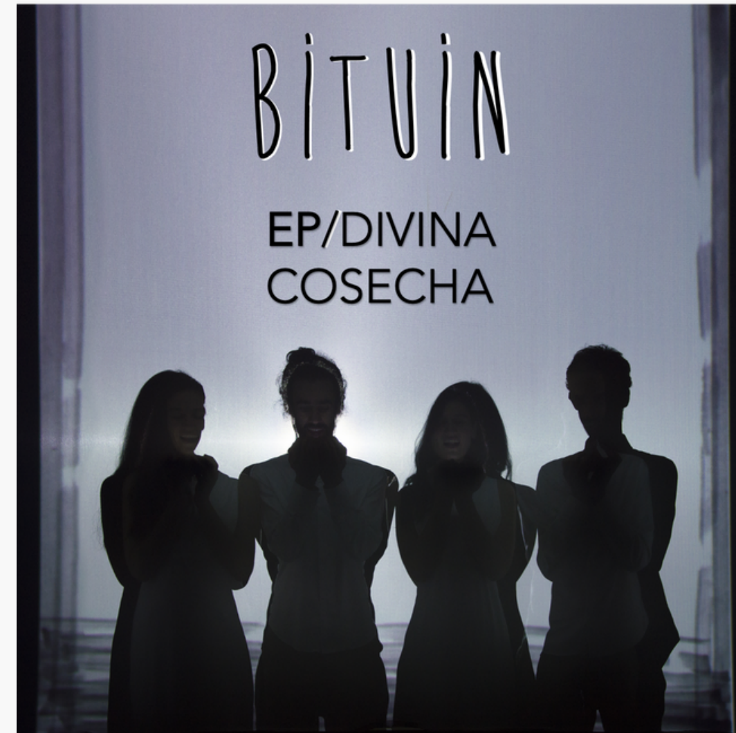
Divina Cosecha (EP). (2021)