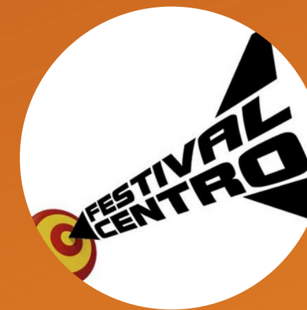
Festival Centro 2019