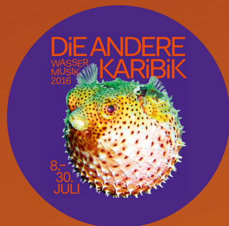
Wassermusik 2016 HKW, Berlín