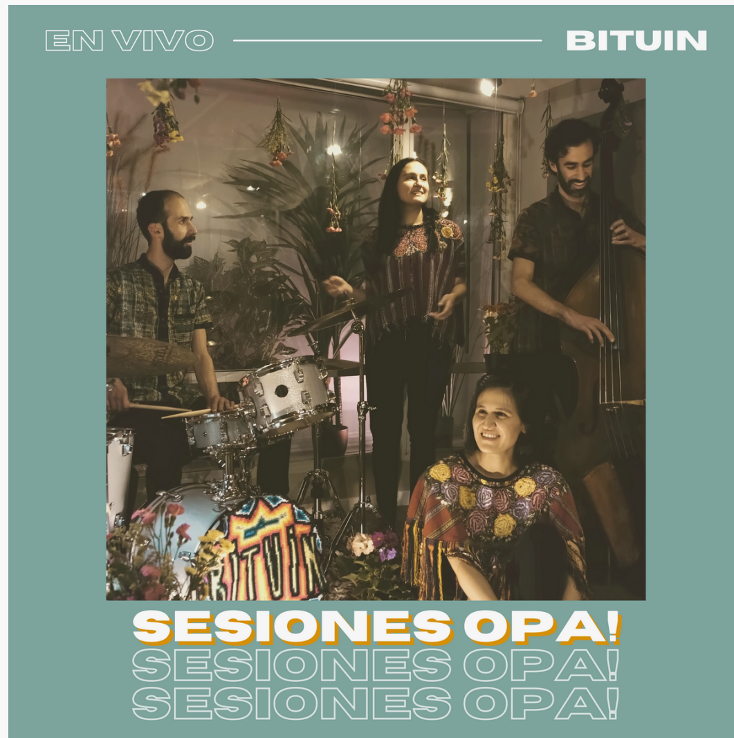
Sesiones Opa! (en vivo). (2022)