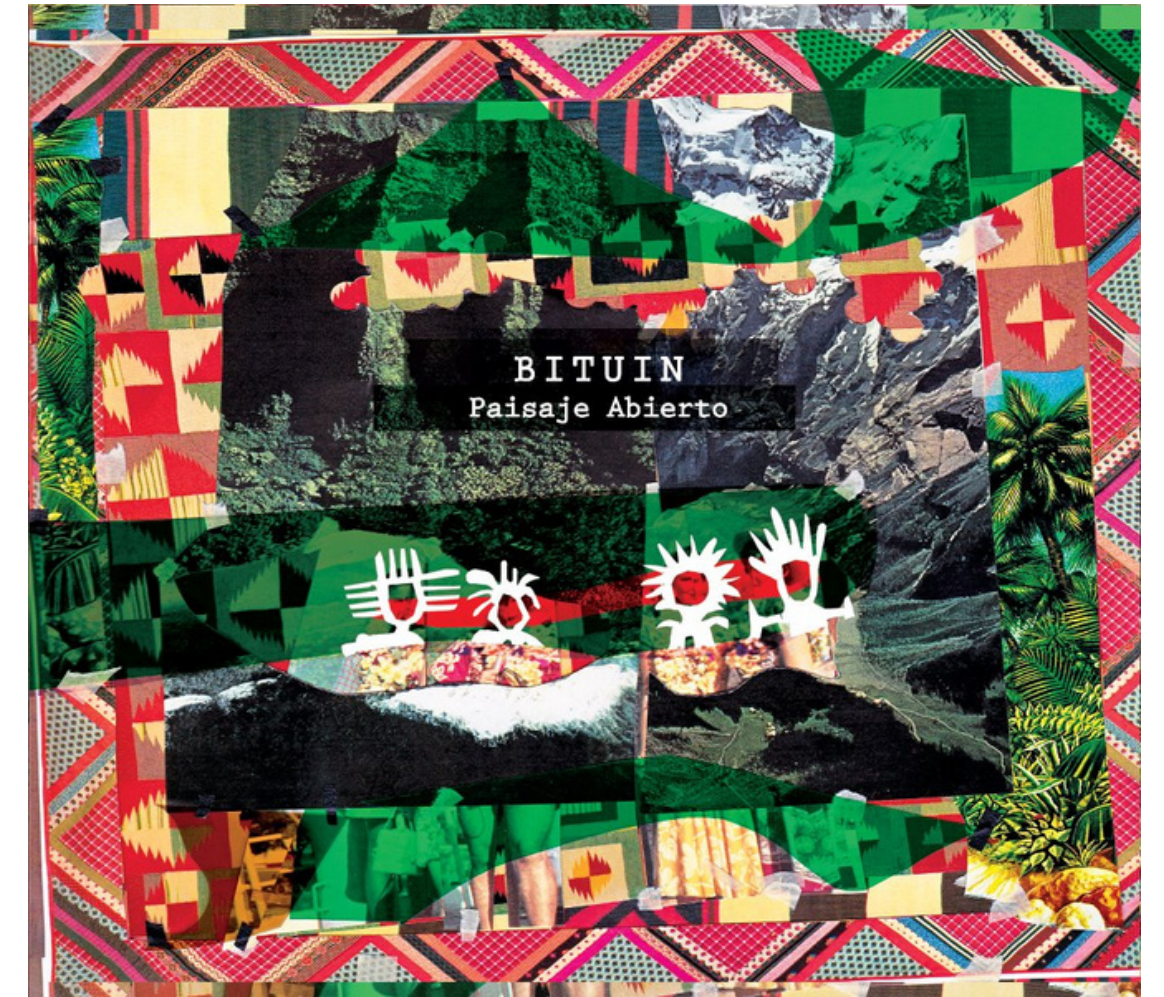
Paisaje Abierto (2011)