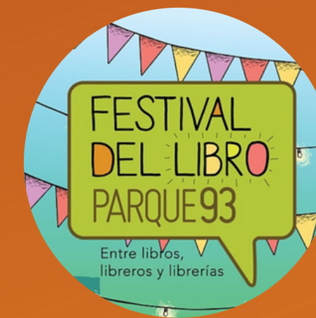
Festival del Libro Parque 93