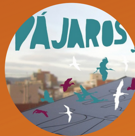
Ciclo Pájaros 2016 Barcelona